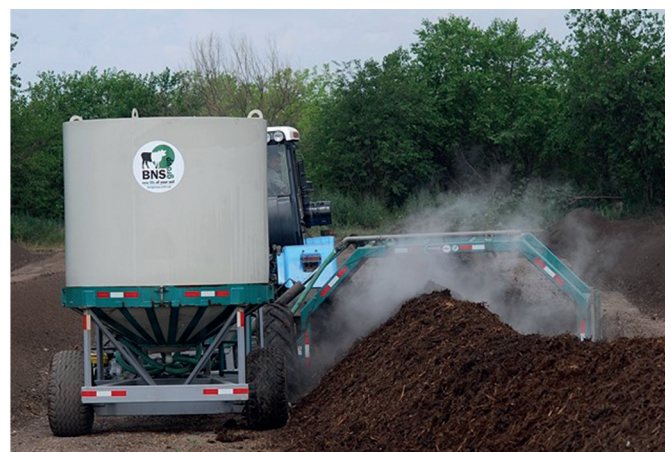
Рисунок 3 – Перемішування кагату