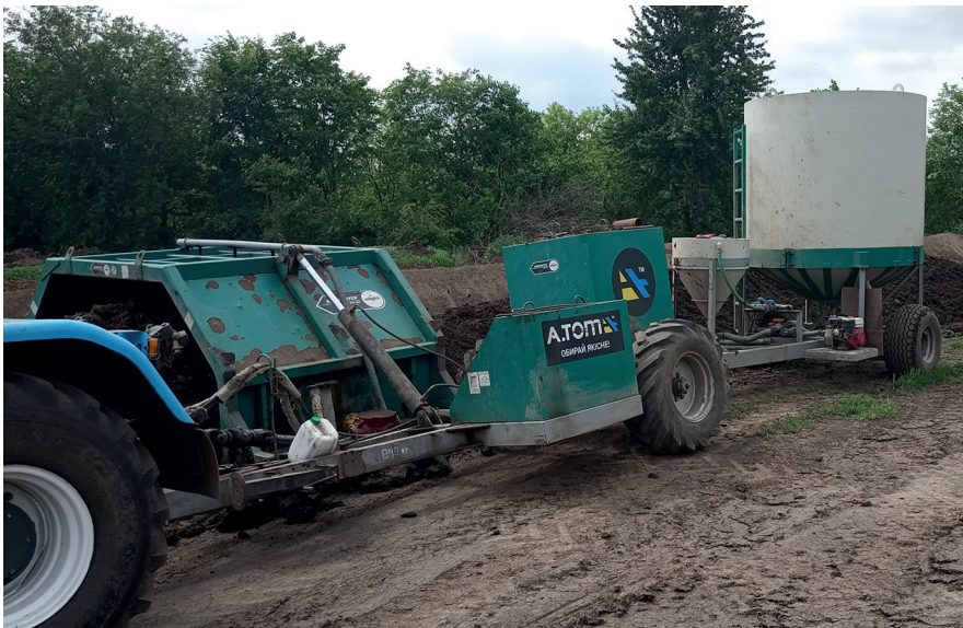
Рисунок 1 – Перемішувач компосту VK-3000

Перемішувач компосту VK-3000 (рис. 1) призначений для отримання високоякісного компосту з органічних відходів сільськогосподарського виробництва. Перемішувач використовується в складі агрегата з трактором ХТЗ-150 на відкритих майданчиках для виробництва компосту.